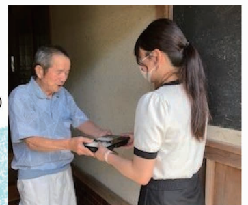
▲配食ボランティアの様子